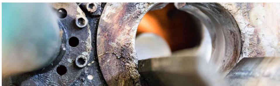
SPOT EXSH1 Z WYTRZYMAŁĄ OBUDOWĄ