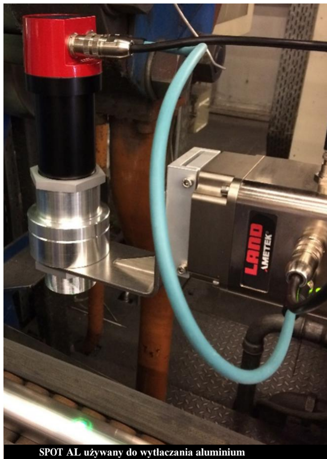
SPOT AL używany do wytłaczania aluminium

SPOT+ TO INNOWACYJNY SAMODZIELNY PIROMETR Z ZAAWANSOWANĄ FUNKCJĄ PRZETWARZANIA DANYCH.