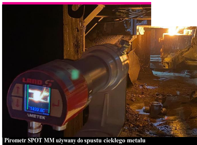
Pirometr SPOT MM używany do spustu ciekłego metalu