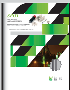
MOCOWANIA I AKCESORIA SPOT

SEE OUR OTHER LITERATURE FOR SPOT FAMILY PYROMETERS: