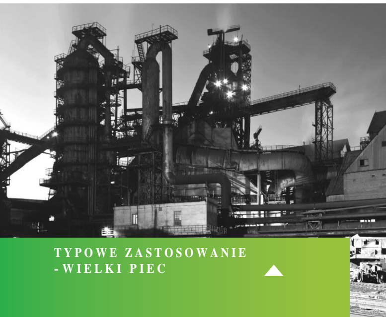
TYPOWE ZASTOSOWANIE - WIELKI PIEC